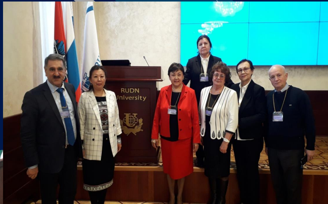
Участники Международной научно-практической конференции «Би-, поли-, транслингвизм и лингвистическое образование», посвященной 90-летию Георгия Дмитриевича Гачева, 2019 г.